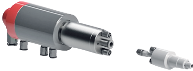
AFT-FLEX BC / 3

Mit Luftanschluss für handelsübliche Luftschläuche 2- oder 3-flutig, zum Betätigen des Pneumatikfutters. Drehdurchführung zweifach gelagert. Verwendung mit gereinigter und geölter Luft.