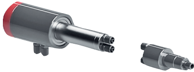
AFT-FLEX BC / 2