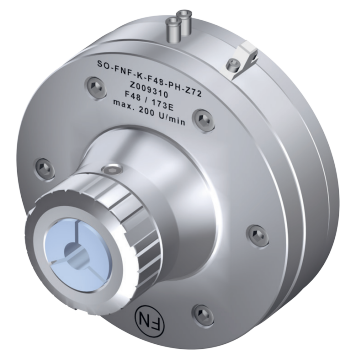
Pneumatisches Vorderend-Spannzangenfutter Typ FNF-K-F48-PH in Sonderausführung