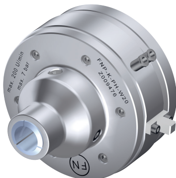
Pneumatisches Vorderend-Spannzangenfutter Typ FNP-K-W25-PH in Sonderausführung