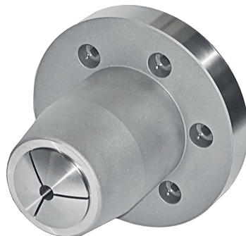
Kraftbetätigtes Zugspannzangenfutter B45